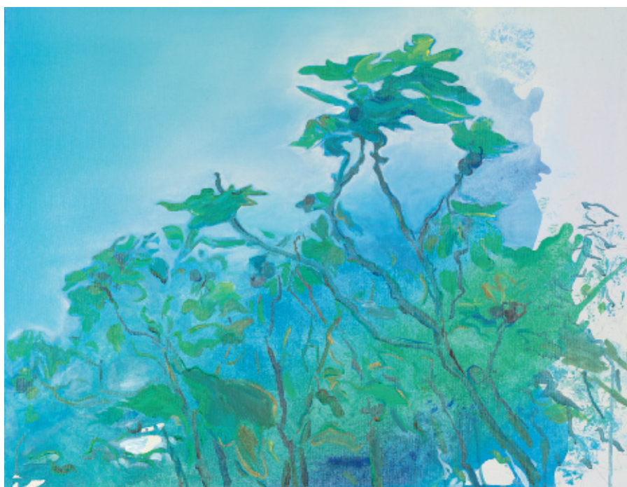
Ingrid Pröllner: „Meerstück 1“, Acryl auf Leinwand, 70 x 90 cm, 2012

Martin Praskas „Geburt der Venus“ spielt mit unseren Assoziationen und der Kombination von unterschiedlichen Realitätsebenen. Wir denken natürlich an die berühmte Venus von Sandro Botticelli, den Urtypus der aus dem aufschäumenden Wasser geborenen Gottheit. Das klassische Thema kombiniert Praska mit einer weiblichen Figur in zeitgenössischem Outfit und abstrakt schwebenden Blütenformen. Die Anordnung in räumlich miteinander nicht korrespondierenden Bildebenen und der Kontrast zwischen plastischer Figur im Vordergrund und der unscharf, in Streifen segmentierten mythologischen Szene schafft eine eigentümlich traumhafte Atmosphäre.