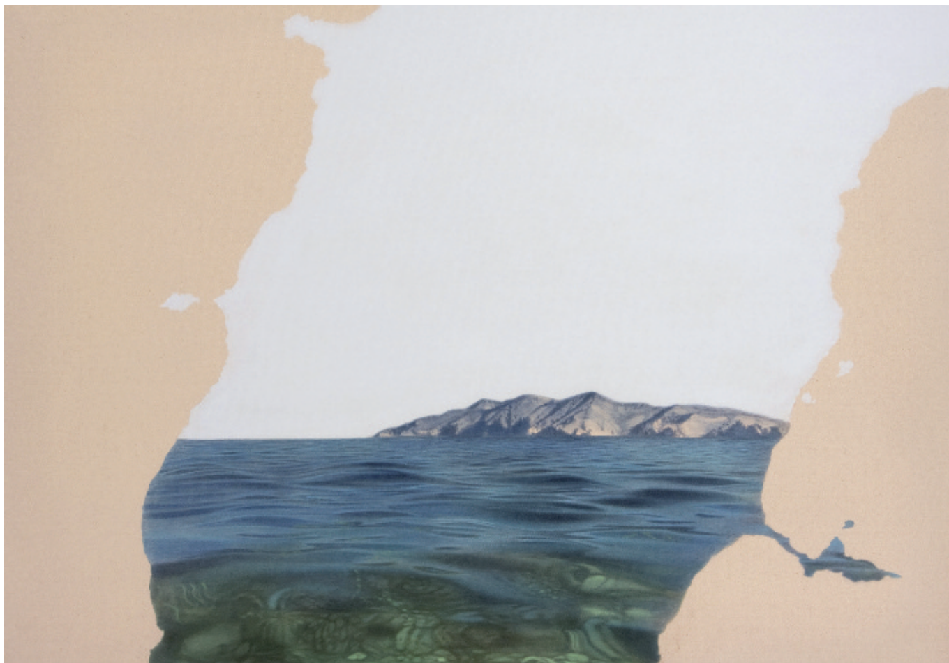
Alfredo Barsuglia: „Wasser“, 70 x 100 cm, Acryl auf Leinen, 2010