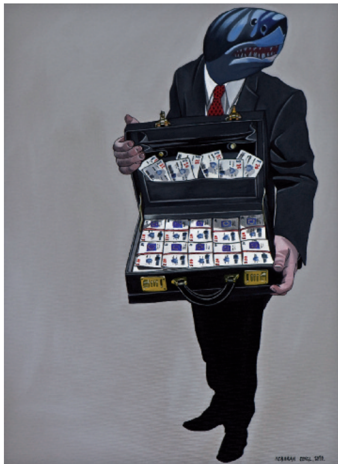
Deborah Sengl: „Hai“, 2010, Acryl auf Leinen, 75 x 55 cm

Wie eine Mondlandschaft erscheint uns die Mürz auf dem gleichnamigen Bild von Christoph Buchegger. Nur durch die Farbgebung können Wasser und Uferzone voneinander unterschieden werden. Das gänzliche Fehlen der umgebenden Landschaft und des Himmels lassen uns geografisch im Unklaren und rücken so gleichzeitig die Bedeutung der Malerei in den Vordergrund. Dennoch spielt die Naturerfahrung anhand von einem gegenständlichen Ausgangspunkt im Schaffen des Künstlers eine wesentliche Rolle. Die Abstraktion seiner Lehrmeister Arnulf Rainer, Markus Prachensky und Walter Obholzer hat er hinter sich gelassen.